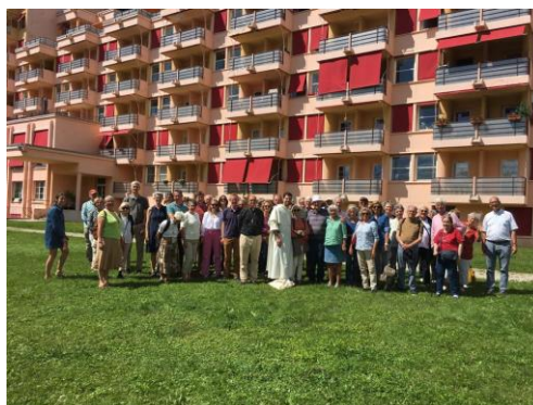
Forum d'Assy finance les travaux de rénovations, n'hésitez pas à participer

N'hésitez pas à nous communiquer des nouvelles idées de sortie pour les années prochaines.